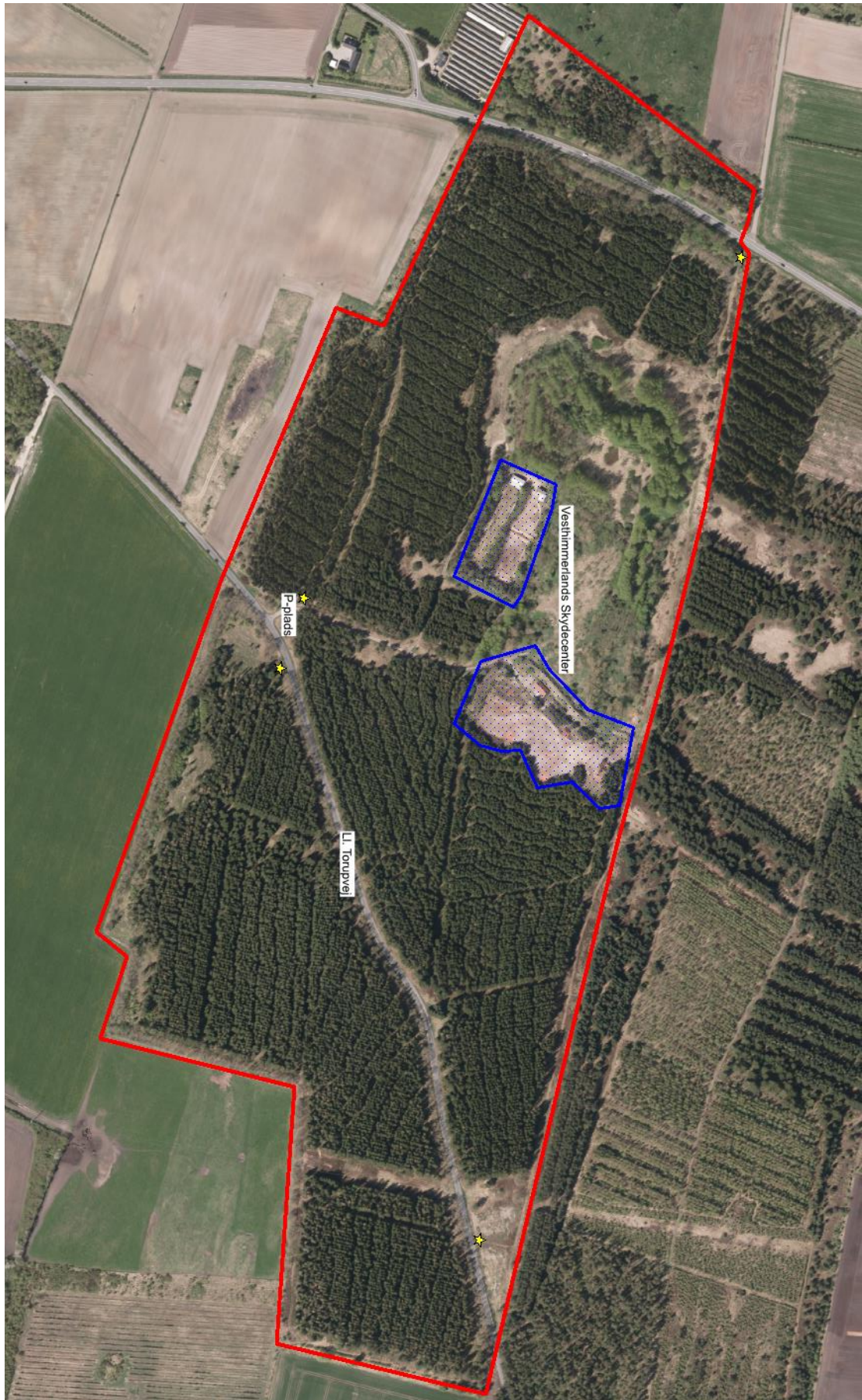
Skilte med jagt i skoven opstilles ved stjernemarkeringerne