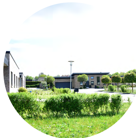
Attraktive bygge- og erhvervsgrunde