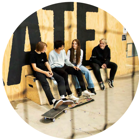
Et sted for vores unge